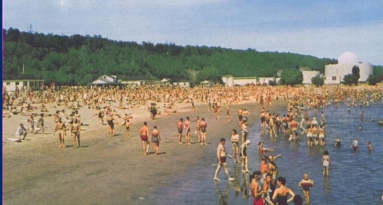
Plage de l'Anse-aux-Foulons (ville de Québec) dans les années 1960